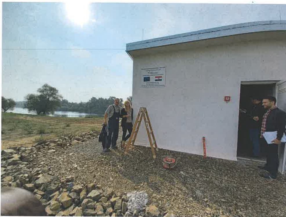
Slika 5. Objekt za elektroopremu (rujan 2021.)

PAYING AGENCY FOR AGRICULTURE, FISHERIES AND RURAL DEVELOPMENT