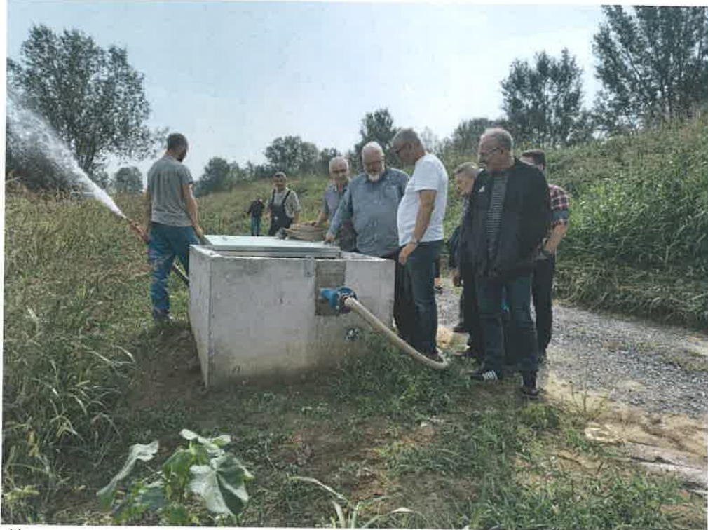
Slika 8. Spojno okno (hidrant) (rujan 2021.)