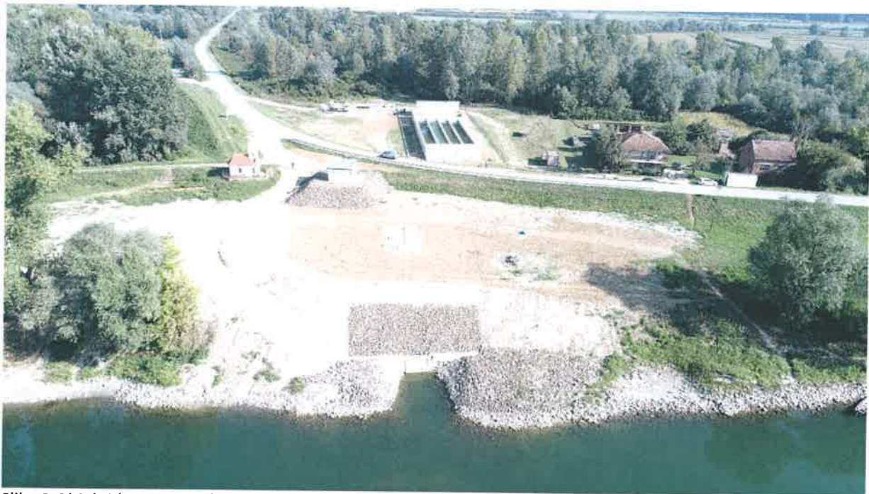
Slika 2. Objekti (rujan 2021.)