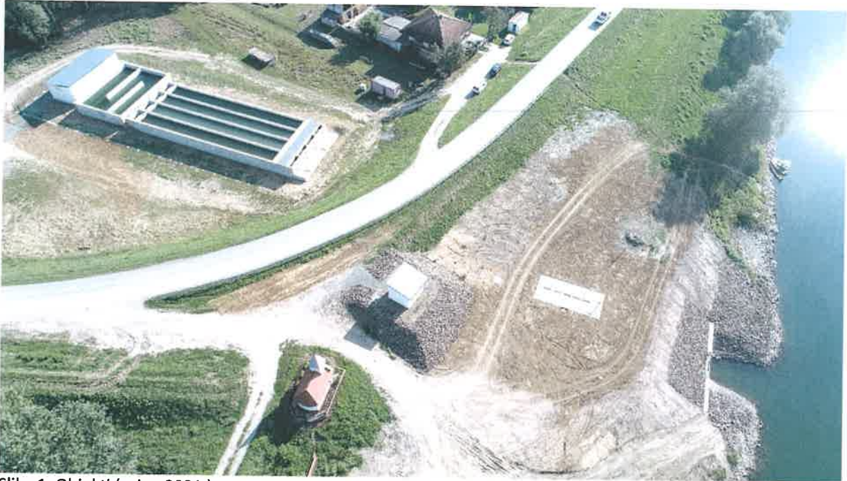
Slika 1. Objekti (rujan 2021.)