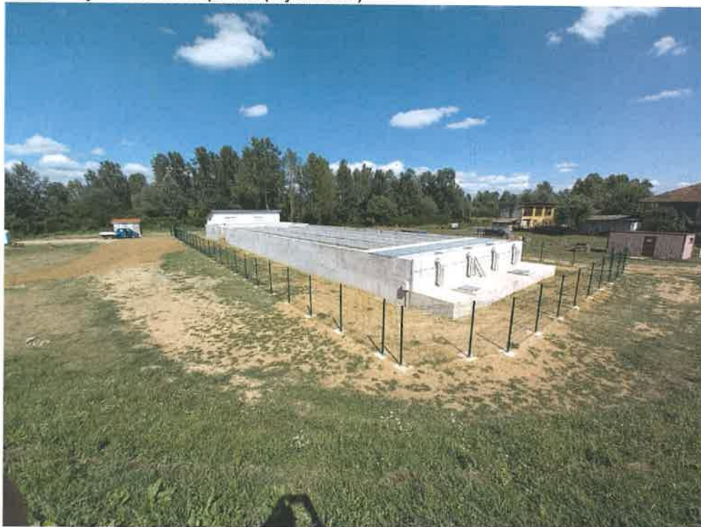
Slika 6. CS 2, retencijski bazen, taložnica (rujan 2021.)