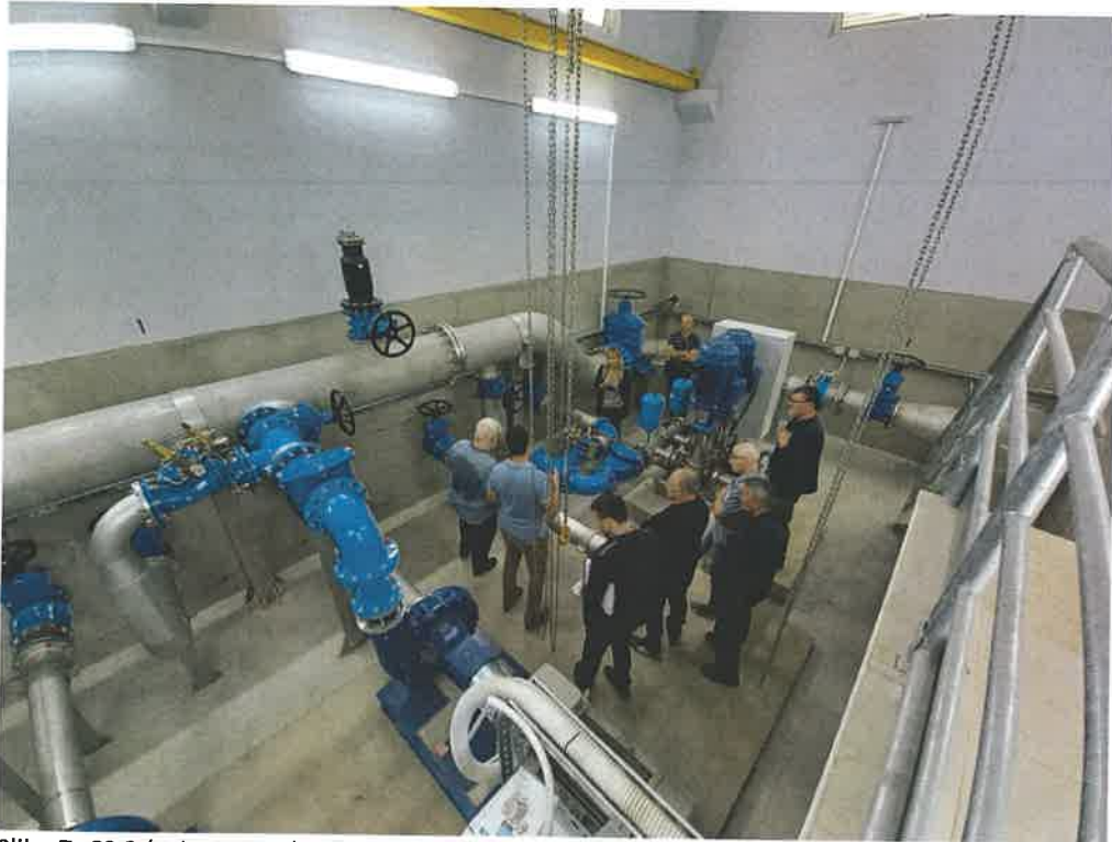
Slika 7. CS 2 (rujan 2021.)