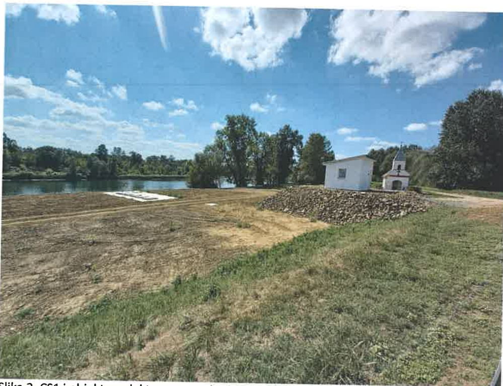
Slika 3. CS1 i objekt za elektroopremu (rujan 2021.)